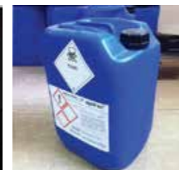
Hóa chất cho hệ thống lạnh Chemicals for cooling towers & chillers