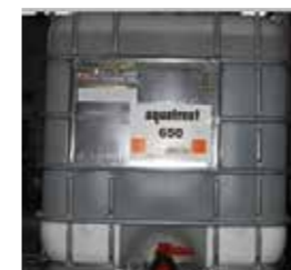
Hóa chất cho nồi hơi Chemicals for boilers