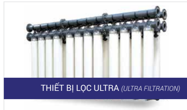
THIẾT BỊ LỌC ULTRA (ULTRA FILTRATION)