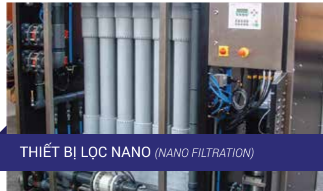
THIẾT BỊ LỌC NANO (NANO FILTRATION)

We know the importance of selecting the right filters, membranes and filtration systems for optimum effectiveness and efficiency. Our computer aided product selection helps you find the right filters for each application. Evaluating size, flow, efficiency, media and other variables will take the guess work out of the process. This provides maximum value for each application: "as fine as necessary" rather than "as fine as possible".