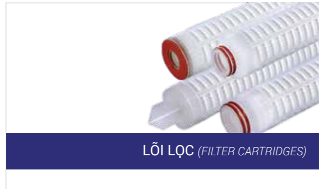
LÕI LỌC (FILTER CARTRIDGES)