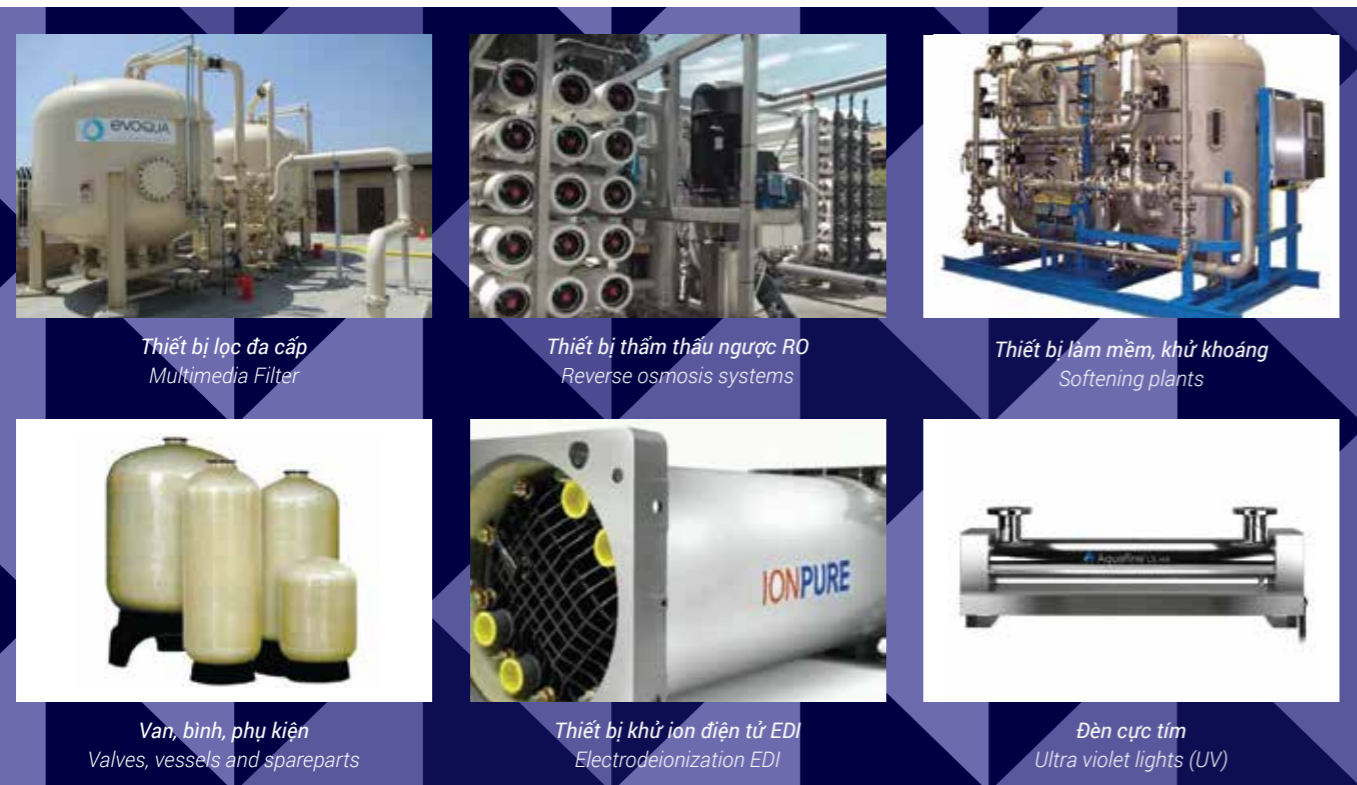
Thiết bị lọc đa cấp Multimedia Filter