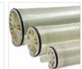
Hóa chất cho màng RO Chemicals for RO membranes