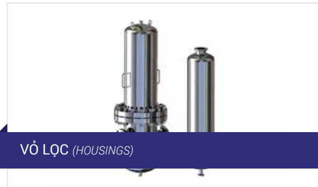
VỎ LỌC (HOUSINGS)