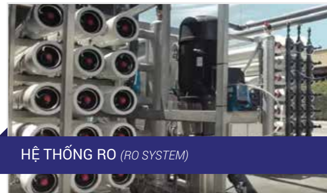
HỆ THỐNG RO (RO SYSTEM)